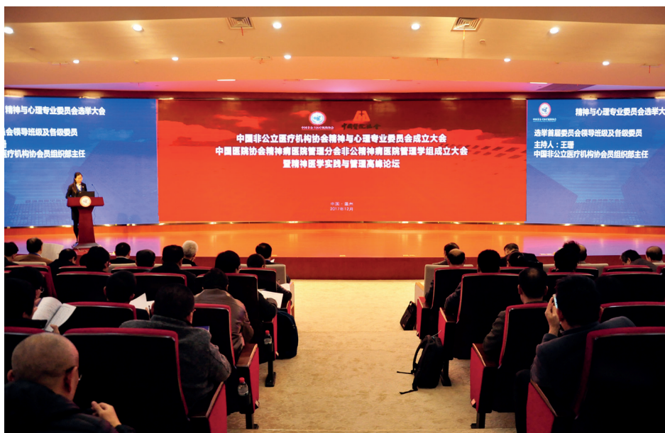
中國非公立醫療機構協會精神與心理專業委員會成立大會暨精神醫學實踐與管理高峰論壇

2017年12月，我們承辦了由中國非公立醫療機構協會主辦的中國非公立醫療機構協會精神與心理專業委員會成立大會暨精神醫學實踐與管理高峰論壇。來自全國各地的近200位精神與心理醫學領域的專家透過此次論壇對精神和心理醫學的發展和前景加深認識，同時對今後醫療工作的開展也開創了新思路。