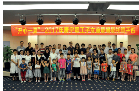
職工子女暑期託管班