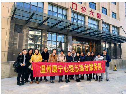
心理志願者服務隊

除此之外，我們亦會不定期舉辦多元化的活動供員工參與，希望平衡員工工作與生活的壓力，建立團隊合作的精神。活動包括籃球和足球聯賽、微電影拍攝活動、無償獻血、參與志願服務、大型周年晚會等。優秀員工更被獲邀到菲律賓長灘島旅行，以肯定他們對公司的貢獻及付出。此外，我們更於去年成立「開心一夏」，為員工的子女開辦暑期託管班，分擔在職父母的壓力。