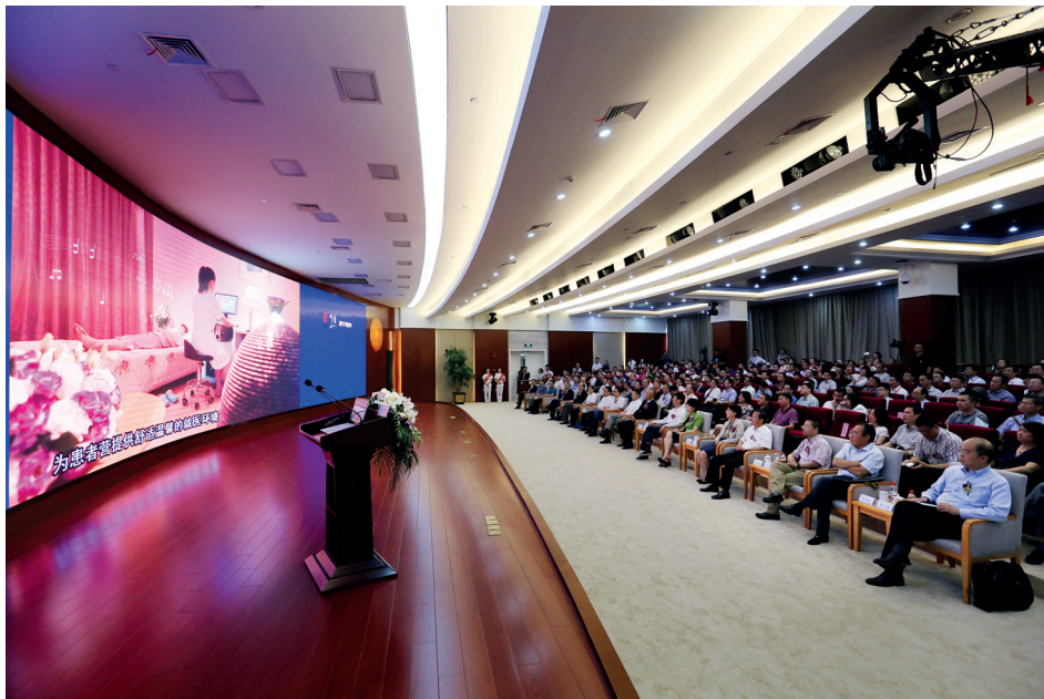
康寧精神醫學國際論壇暨溫州醫科大學精神衛生周

2017年9月，為進一步提升對兒童精神健康的關注，本集團與溫州醫科大學精神醫學學院共同舉辦「康寧精神醫學國際論壇暨溫州醫科大學精神衛生周」，邀請世界兒童與青少年精神病協會主席等國內外兒童領域專家，吸引到超過400位業內專家共同探討兒童精神衛生領域的前沿觀點和臨床實踐，為精神科醫生和精神心理領域專家之間建立一個交流的平台。