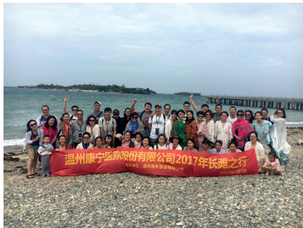
優秀員工長灘島旅行