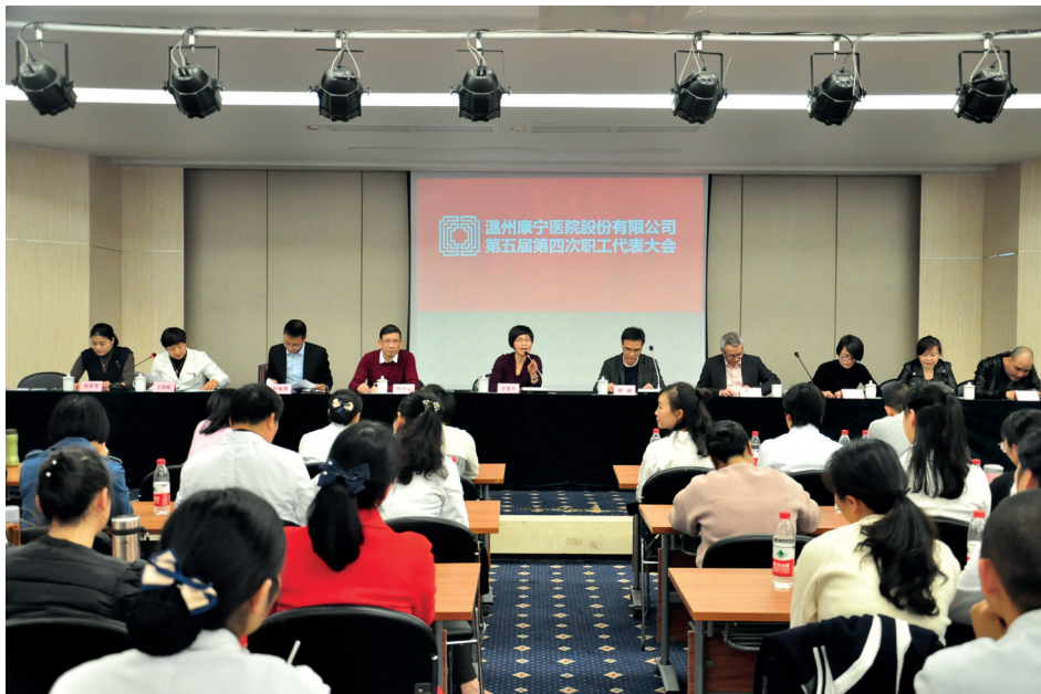
2017年度職工代表大會

本集團一直非常重視與員工的關係，並且積極維繫與各級員工的有效溝通，建立一個彼此互信的工作環境及維持良好的勞資關係。我們一直善用於2012年成立的職工代表大會，每年度與員工一同討論、審議及確認集團年度優秀人物。2017年的職工代表大會於2017年3月進行，並表決通過《溫州康寧醫院工作報告》、《溫州康寧醫院股份有限公司工會2016年工會經費收支情況工作報告》。除此之外，我們亦設有恆常溝通渠道讓員工自由發表意見，下情上達，員工可以致電或親身向人力資源部發表對公司的意見，以促進不同階層員工的溝通。